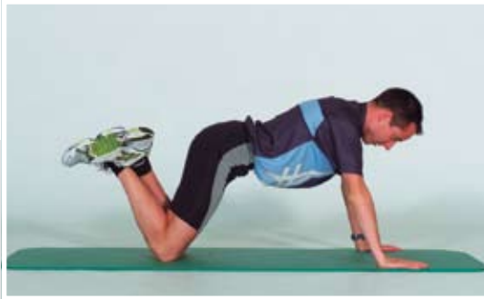
Liegestütz auf den Knien, Arme gestreckt.