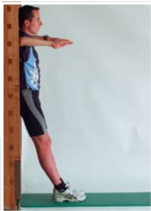
Schräg an die Wand gelehnt, die Füße 1 bis 2 Schuhlängen von der Wand entfernt, Ellbogen rechtwinklig gebeugt, Oberarme seitlich in Schulterhöhe, ganzer Körper gerade halten.