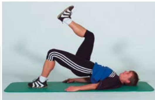
Becken heben und senken, dabei den Boden nur leicht berühren, Oberschenkel und Rumpf sollten eine Linie bilden.