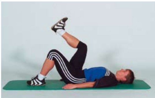
Rückenlage. Ein Bein angestellt, das andere Bein mit gebeugtem Hüft- und Kniegelenk abheben.