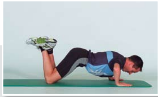
Beugen und strecken der Arme, den Rücken während der Übungsausführung gerade halten.