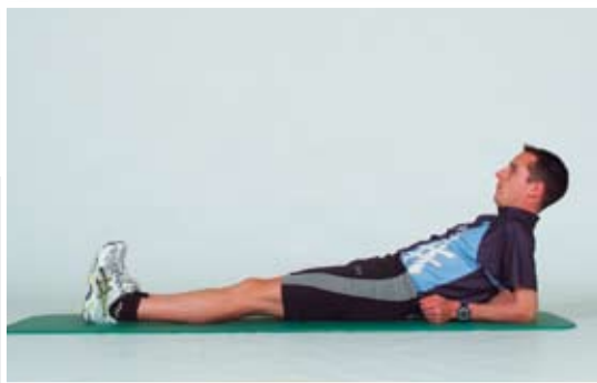
Unterarmstütz rückwärts. Beine gestreckt, Kopf in der Verlängerung der Wirbelsäule