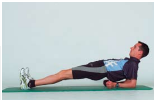
Becken heben und senken, dabei den Boden nur leicht berühren, Hüfte strecken, Kniegelenke nicht überstrecken.