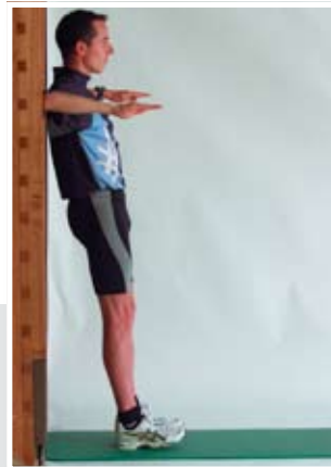
Gestreckter Körper mit den Armen nach vorne wegdrücken, bis die Schulterblätter 5 Zentimeter von der Wand abgehoben sind, und wieder zurück, die Schulterblätter berühren in der Rückwärtsbewegung die Wand nicht.

Literatur: Zum Thema Kräftigung gibt es zahlreiche Handbücher. Im Folgenden wird nur die für diese Beilage verwendete wissenschaftliche Literatur vorgestellt.